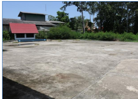
โรงสีเทพประทาน ๒ และลานตากข้าว