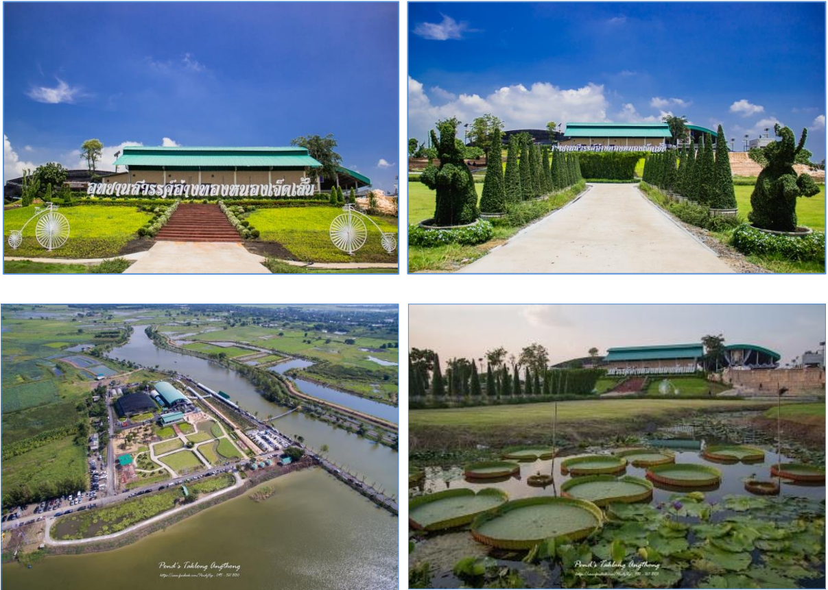
อุทยานสวรรค์อ่างทองหนองเจ็ดแสน จังหวัดอ่างทอง