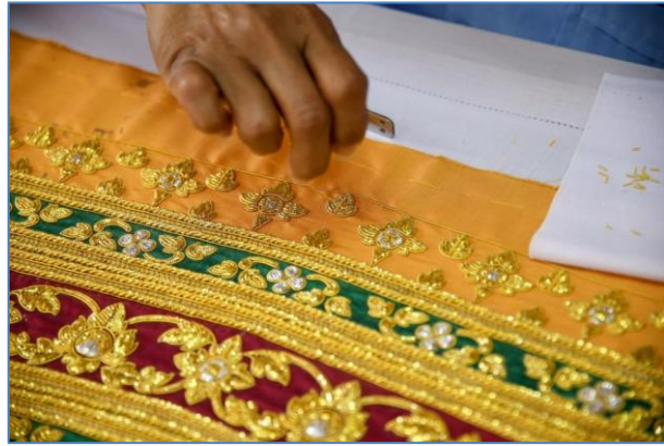
การปักผ้า ชุดโขน และผ้าทอ