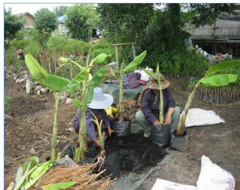
การเพาะชำต้นอ่อน