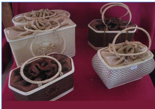
จักสานไม้ไผ่