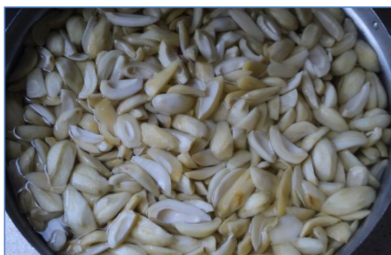
มะม่วงแช่อิ่ม