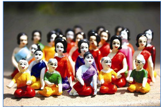
ตุ๊กตาชาววัง