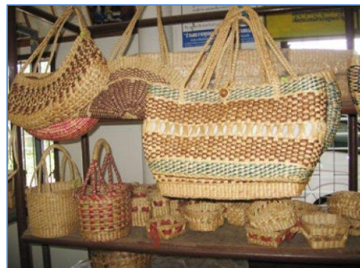
จักสานผักตบชวา