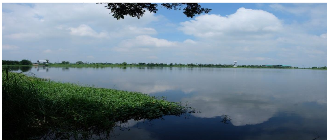
พื้นที่เก็บน้ำเพื่อการเกษตรในโครงการแก้มลิง หนองเจ็ดเส้น

โครงการแก้มลิงหนองเจ็ดเส้น ตั้งอยู่ที่ ฝั่งตะวันตกของถนนพหลโยธิน ครอบคลุมพื้นที่ตำบลสายทอง ตำบลโรงช้าง อำเภอป่าโมก และตำบลหัวไผ่ อำเภอเมือง จังหวัดอ่างทอง มีพื้นที่ทั้งหมด ๓๒๐ ไร่ ประกอบด้วยสระน้ำ จำนวน ๓ สระ (ปัจจุบันขุดเชื่อมเหลือเพียง ๒ สระ) มีพื้นที่ ๙๙ ไร่ และ ๑๖๓ ไร่ ตามลำดับ ส่วนที่เหลือเป็นพื้นที่คันดิน และพื้นที่พัฒนาการเกษตรตามแนวพระราชดำริเศรษฐกิจพอเพียง