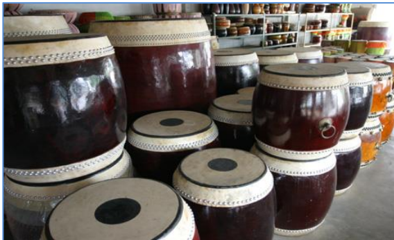
กลองตำบลเอกราช