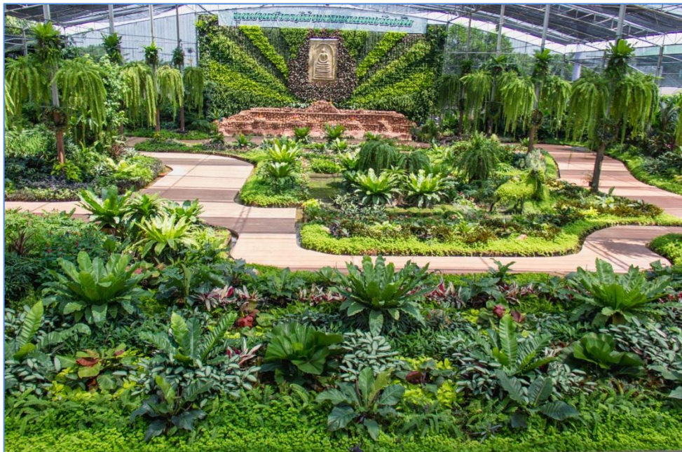
“สวนสวรรค์พันธุ์ไม้งาม” แหล่งเรียนรู้พันธุ์ไม้เขตร้อนชื้น