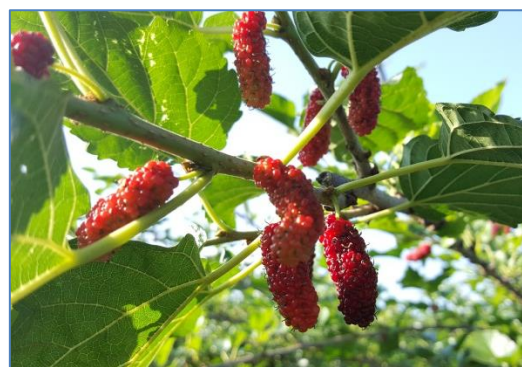
ลูกหม่อน