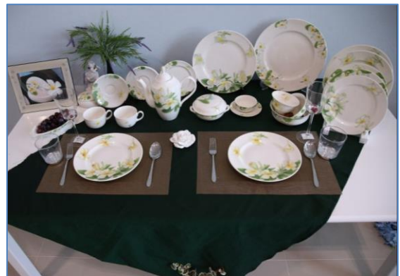
ผลิตภัณฑ์เซรามิก

๕.๕.๓ โครงการฝึกอาชีพตุ๊กตาชาววัง ศูนย์ตุ๊กตาชาววังบ้านบางเสด็จ หมู่ที่ ๒ ตำบลบางเสด็จ อำเภอบ้านฉาง จังหวัดอ่างทอง