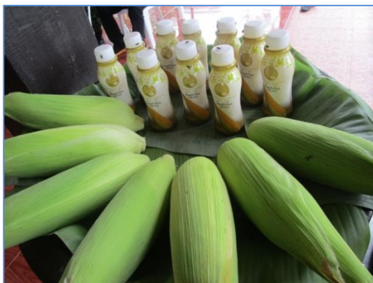
น้ำข้าวโพด