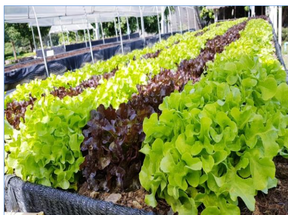
ผักไทย ผักสลัด ไม้ผลและพืชไร่