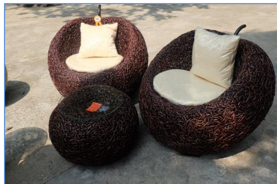
จักสานหวาย