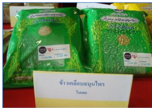
เครื่องสีข้าว และผลิตภัณฑ์ข้าว