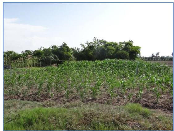
การปรับปรุงคุณภาพดิน ในโครงการแก้มลิงหนองเจ็ดเส้น