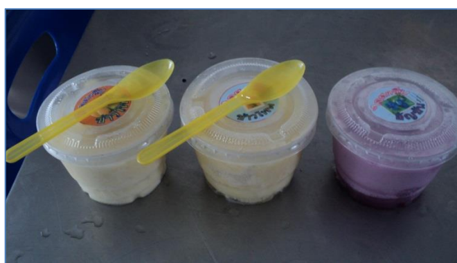
ไอศกรีม จากวัตถุดิบของโครงการฯ ได้แก่ หม่อน ข้าวโพด ข้าวไรซ์เบอร์รี่ นมแพะ