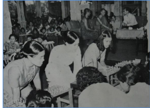
การเสด็จพระราชดำเนิน