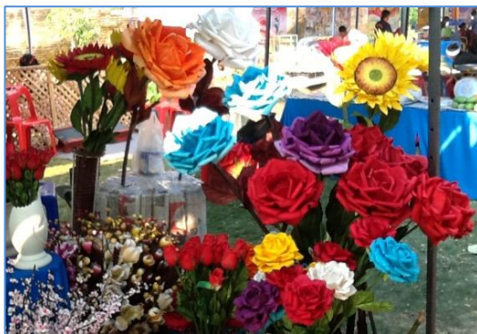
ดอกไม้ประดิษฐ์