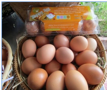
ไข่ไก่อารมณ์ดี