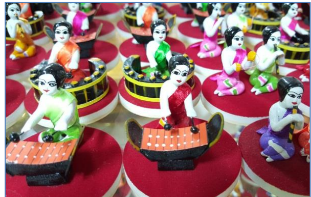
การปั้นตุ๊กตาชาววัง