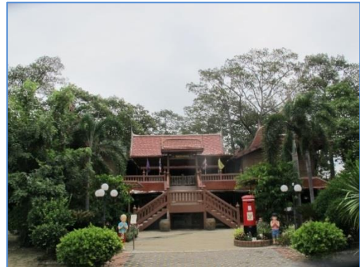
ศูนย์ตุ๊กตาชาววังบ้านบางเสด็จ