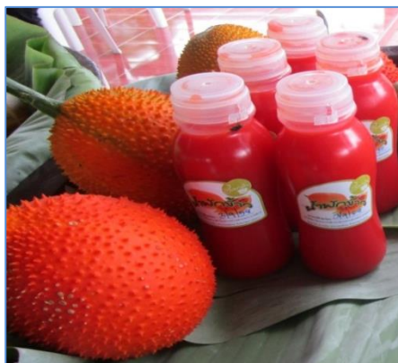
น้ำฟักข้าว