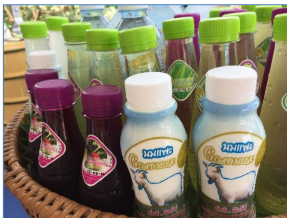
เครื่องดื่ม ได้แก่ น้ำใบเตย น้ำมะนาว น้ำลูกหม่อน นมแพะพาสเจอร์ไรซ์ และน้ำเปล่า